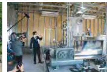
大阪大学教授による説明状況