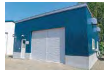
パイロットプラント 外観

今後は、研究試運転を重ね、効率的な生産が可能な開発を進める予定です。最終的には、2030年度以降の実用化に向けて、日本国内全体へ「循環型酪農システム」の展開を目指しています。