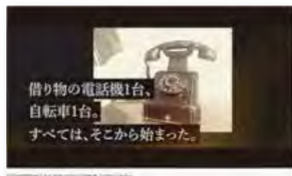
記念映像「100年のあゆみ」製作