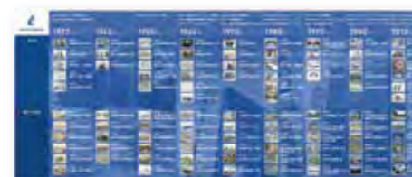
100年史およびデジタル年史の製作