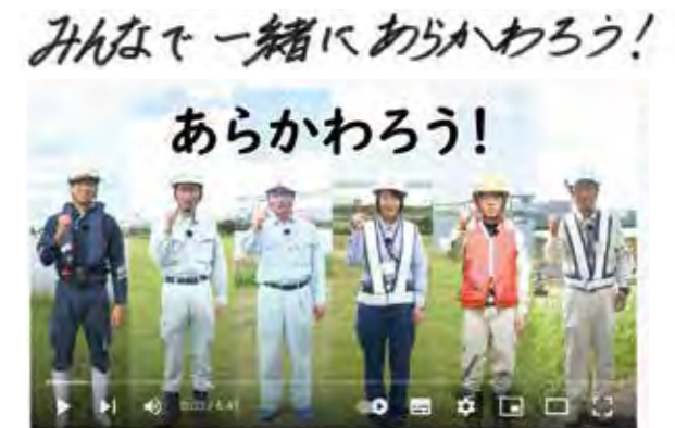
【Youtube】国土交通省荒川下流河川事務所チャンネル #みんなで一緒にあらかわろう

今回当社では、国土交通省関東地方整備局荒川下流河川事務所の理念「みんなで一緒にあらかわろう!」の理念に基づき、流域工事に関わる他社も含めたSDGsの取り組みについてYoutubeにて情報発信を行いました。また江戸川区チャレンジ・ザ・ドリーム(職場体験)の活動を実施することで、工事を通じたSDGsの取り組みや地域住民との関わりも知ってもらいました。工事を通じたパートナーシップの積極的な形成を行っています。