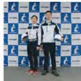
「新ユニフォーム」の導入