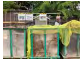
産業廃棄物分別の推進例

当社の各作業所では、様々なCO2削減活動を現場状況に合わせて実行しています。しかし、工事の種類や周辺環境により、その効果が見えにくいという状況がありました。そこで「SDGsアクションプロジェクト」と題し、作業所でのCO2削減活動や廃棄物の分別化などの優れた取り組みに対してポイントを付与し、規定以上を達成した作業所に、「サステナブル作業所認定」をするなどの検討しています。