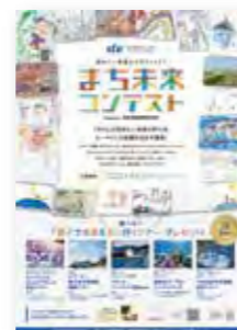
まち未来コンテスト